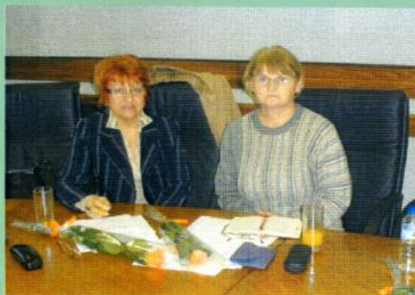
Delegati iz Banja Luke