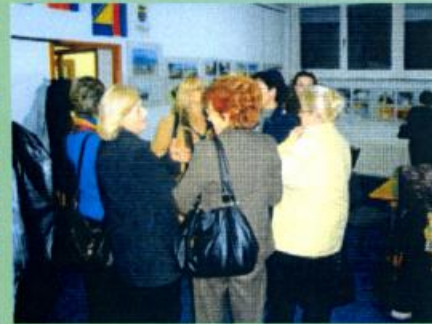
Posjetioci razgledaju izložbu