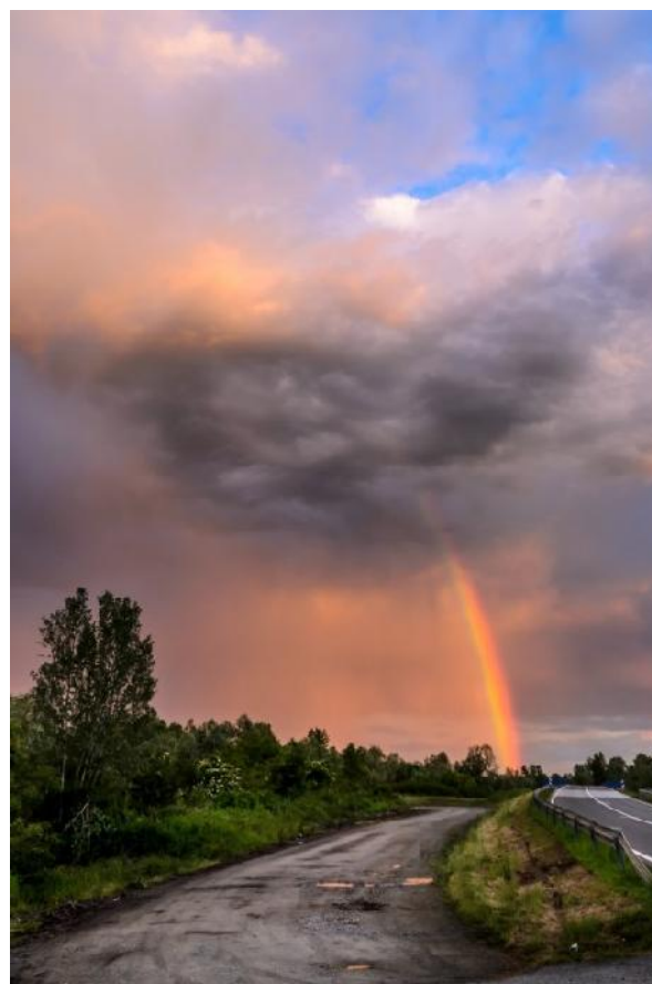
Autor : Armin umiši