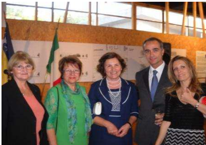
Članovi Udruženja Italijana grada Banjaluka sa ambasadorom Italije – Ruggero Corrias i njegovom suprugom

Povodom nacionalnog praznika Dana Republike Italije, Ambasada Italije u BiH, organizirala je prijem 04.06.2014. u depou „Ars Aevija“. Svečanosti su prisustvovala mnoge istaknute ličnosti iz diplomatskog, kulturnog i političkog života BiH, kao i predstavnice našeg Udruženja. Dan Republike Italije se obilježava kao znak